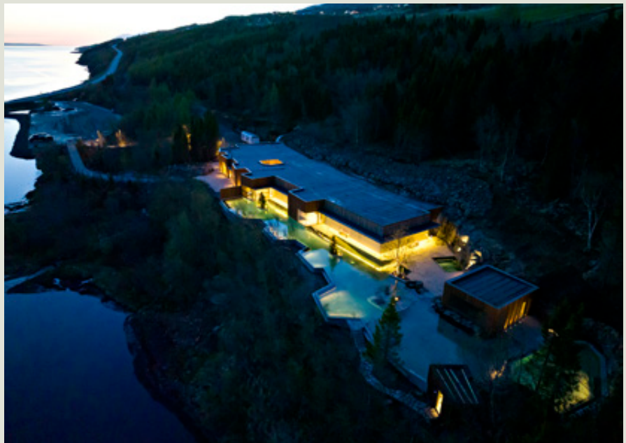
Skógarböðin glæsileg í ljósaskiptunum.