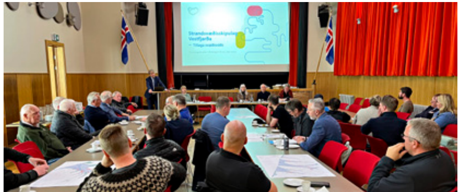
Frá kynningarfundum í Bolungarvík.

Við mótun skipulagstillagnanna hefur verið aflað yfirgrípsmikilla upplýsinga um náttúrufar, vistkerfi, veiðar, siglingar og önnur þau not sem nú fara fram í viðkomandi fjörðum og flóum. Mikil vinna hefur farið í að ná saman heildstæðum greiningum byggt á fyrirliggjandi gögnum en