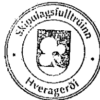
Hildur Gunnarsdóttir skipulagsfulltrúi