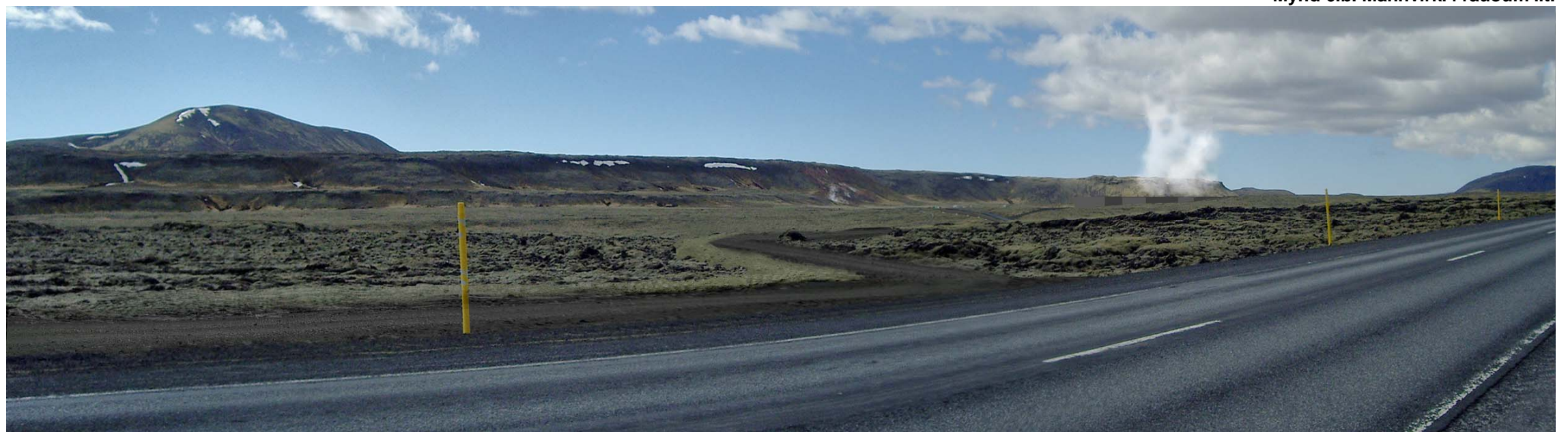
Mynd 6.c. Aætlaður sýnileiki mannvirkja að loknum framkvæmdum.