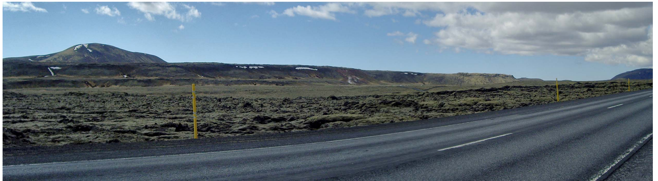
Mynd 6.a. Án mannvirkja.