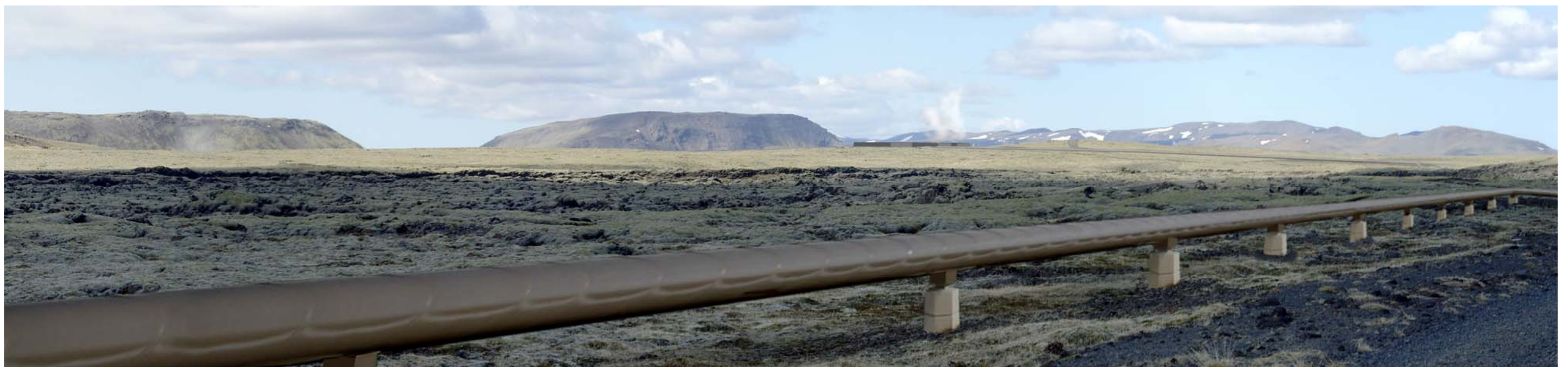
Mynd 7.c. Áætlaður sýnileiki mannvirkja að loknum framkvæmdum.