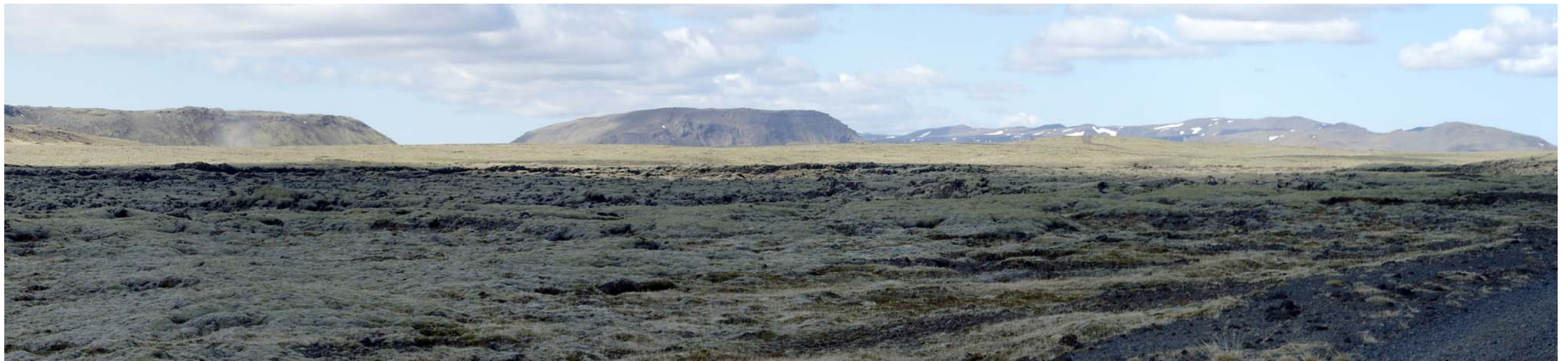
Mynd 7.a. Án mannvirkja.