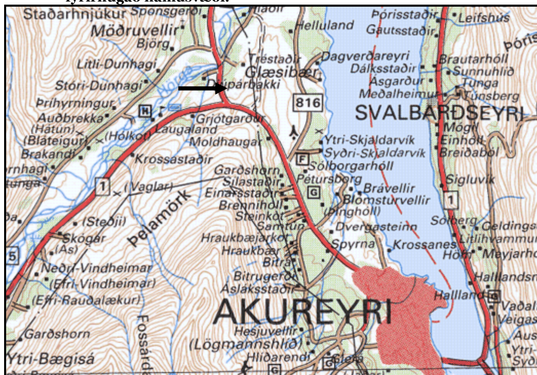
Mynd 1. Yfirlitskort sem sýnir staðsetningu námunnar í Skútum. Örin vísar á fyrirhugað námusvæði.